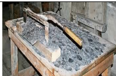
Blick in den über 100 jährigen Schieferbearbeitungsraum

Sämtliche Werkzeuge, Gerätschaften und Maschinen, die es zur Herstellung von Schreibtafeln braucht, sind noch vorhanden. Schieferstaub, Sägemehl und Leimgeruch zogen wieder in die Räume ein.