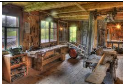
Blick in den über 100 jährigen Schieferbearbeitungsraum

Sämtliche Werkzeuge, Gerätschaften und Maschinen, die es zur Herstellung von Schreibtafeln braucht, sind noch vorhanden. Schieferstaub, Sägemehl und Leimgeruch zogen wieder in die Räume ein.